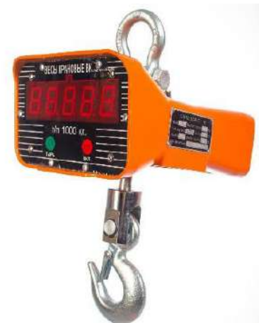
Рисунок 2. Общий вид весов крановых OCS

Общий вид весов представлен на рисунке 2.